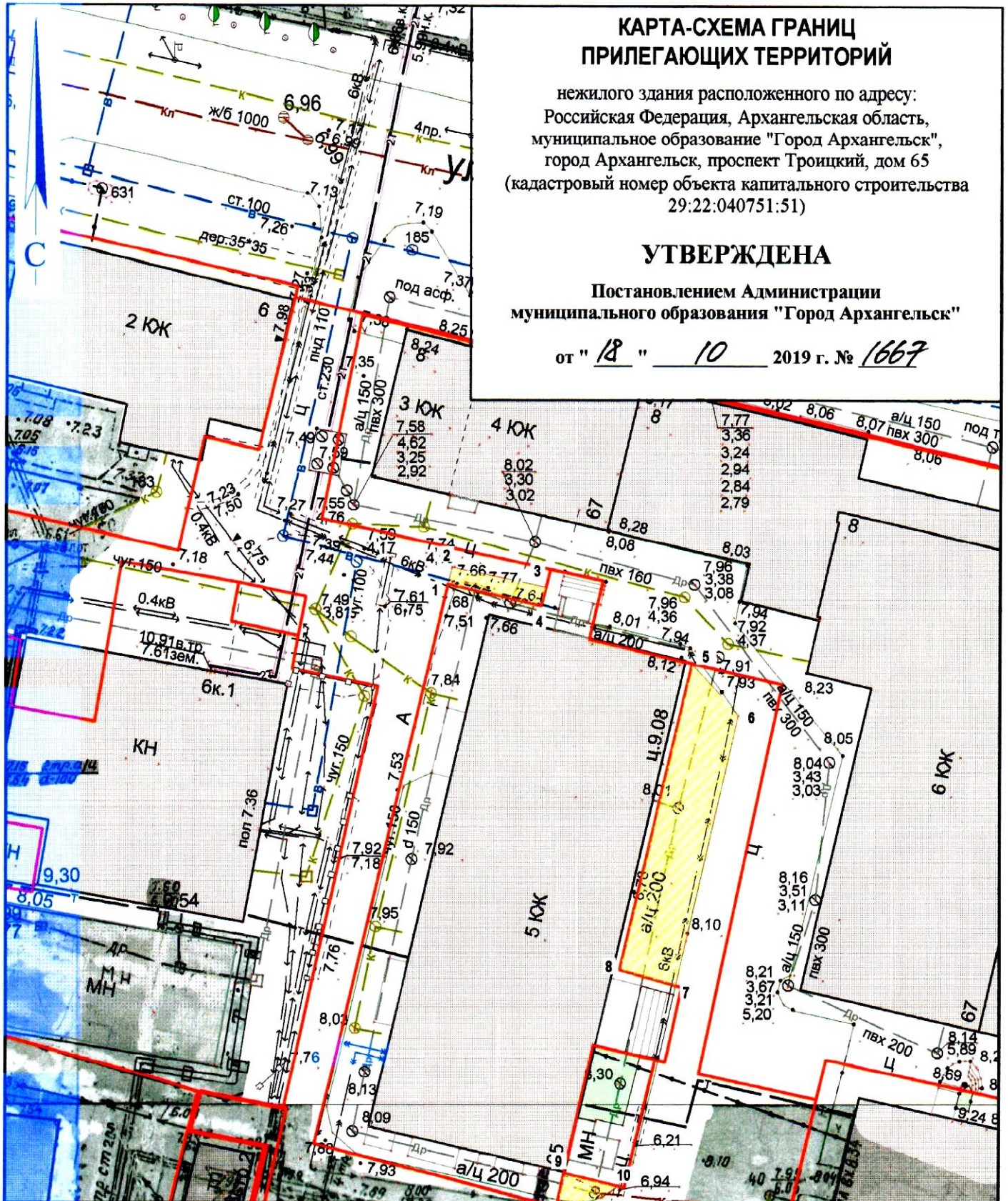
Система координат МСК-29